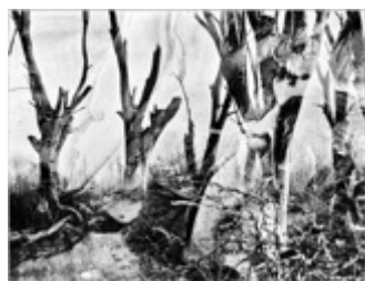
From the series »Entrevero«, #III-I , 2015

Pressekonferenz Eröffnung RAY 2018: Mittwoch, 23. Mai 2018, 11 Uhr