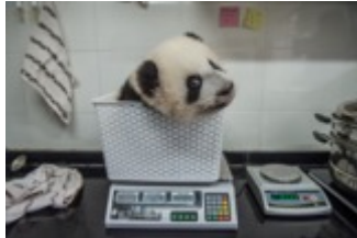
A Cub gets weight, from the series »Pandas Gone Wild«, 2015

Pressekonferenz Eröffnung RAY 2018: Mittwoch, 23. Mai 2018, 11 Uhr