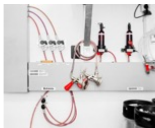
Aus der Serie »Intensivstationen II«

Pressekonferenz Eröffnung RAY 2018: Mittwoch, 23. Mai 2018, 11 Uhr