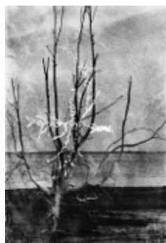
From the series »Entrevero«, #IV-II, 2015