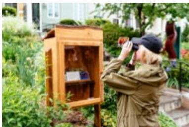
Installationsansicht aus der Serie »Birding the Future«, Queensland Australia Series, 2013