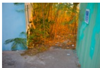
Montrouis, Haiti, 2011. From the series »The Third Heaven«, 2006–2012