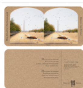
»Dreams« (detail) aus der Serie »Birding the Future«, Mid-Atlantic USA Series, 2016