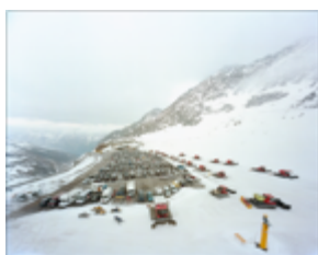
Aus der Serie »Gletscherpathologie« © Lois Hechenblaikner