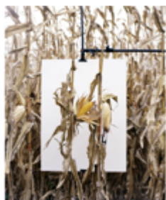
Van Buren, Indiana, 2013, aus dem Projekt »Monsanto®. A photographic Investigation« © Mathieu Asselin

Pressekonferenz Eröffnung RAY 2018: Mittwoch, 23. Mai 2018, 11 Uhr