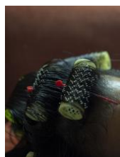
Her Curlers. Aus der Serie "Mother Tongue", 2019

Pressekonferenz: Freitag, 18. September 2020, 12 Uhr