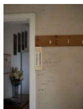
Growth Chart. Aus der Serie "Mother Tongue", 2019