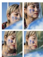
The Twin Sisters. Aus der Serie “I Have Nothing to Tell You”, 2019