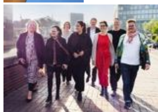
recommended-Stipendiatinnen und Stipendiaten sowie das Kuratoren-Team 2019/2020.