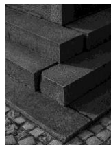
DEPONIE #004, 2019