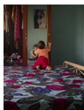
Touch. Aus der Serie "Mother Tongue", 2019