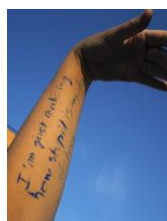
Finding Rooftops II. Aus der Serie "I Have Nothing to Tell You", 2019