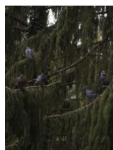
Family Tree. Aus der Serie "Mother Tongue", 2019

Pressekonferenz: Freitag, 18. September 2020, 12 Uhr