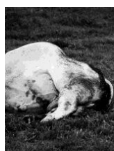
DEPONIE #013, 2019

Pressekonferenz: Freitag, 18. September 2020, 12 Uhr