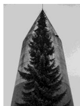
DEPONIE #024, 2019