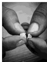
DEPONIE #010, 2019