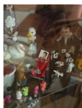
Son. Aus der Serie "Mother Tongue", 2019